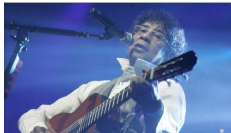
Laurent Voulzy était déjà venu au palais des congrès de Vittel en 2007.