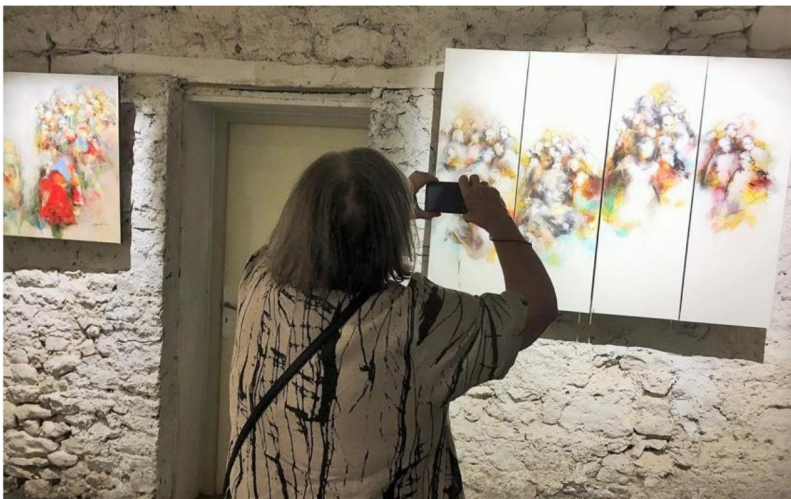
Tous les dimanches d'été, l'expo de la galerie TEM fait de Goviller « the place to be ».