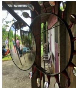
Ça se passe aussi dehors !