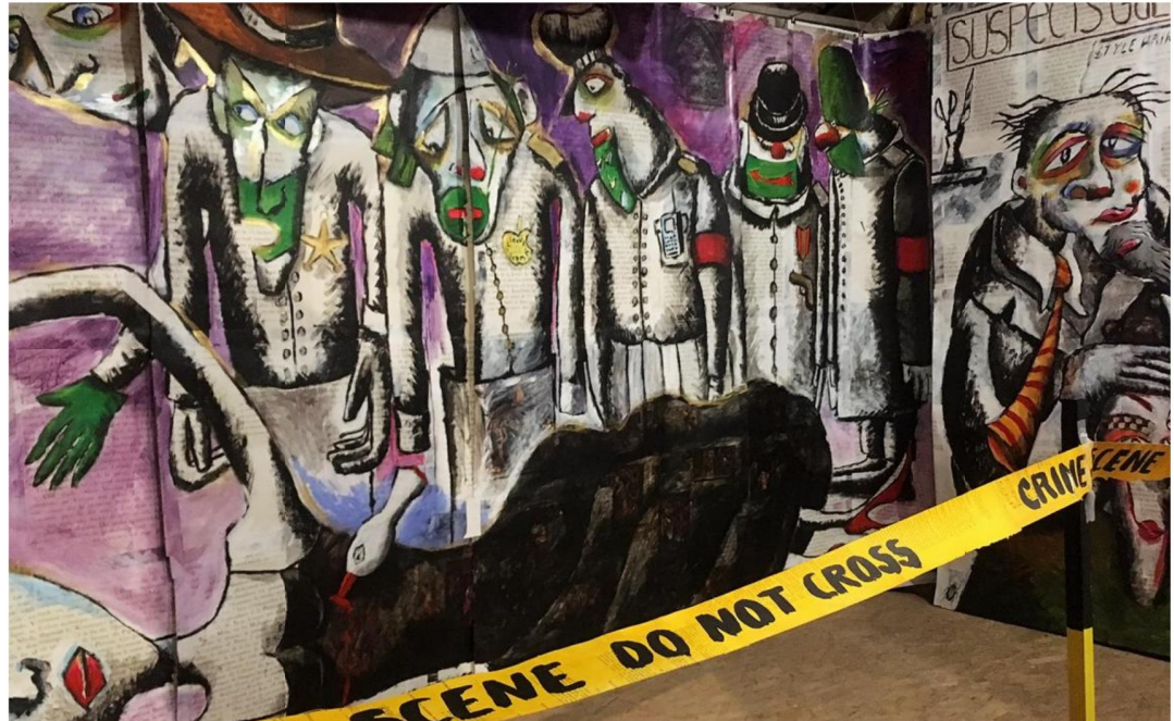
Clair Artur nous embarque dans un polar labyrinthique en trois dimensions. À nous d'en reconstituer le récit !