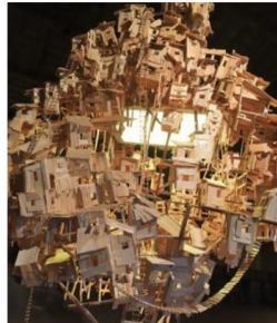
De Dominique Grentzinger.