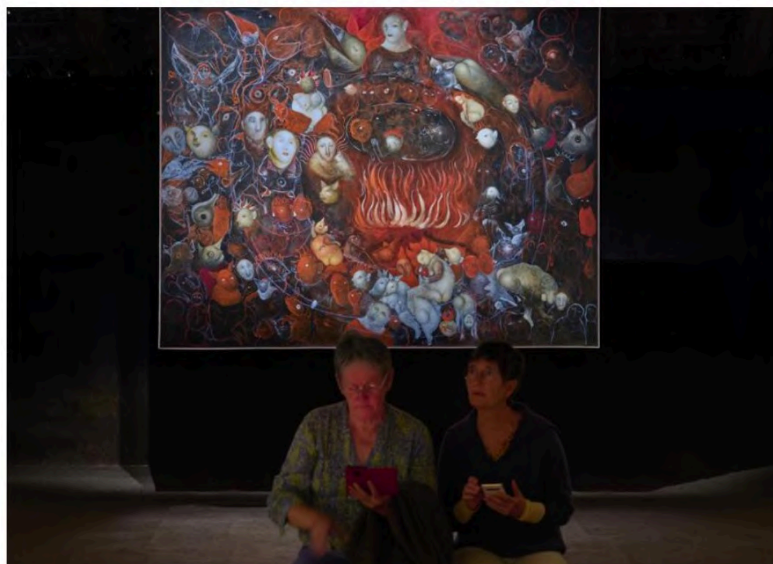
La Nef des Bêtes, de Nicolas Galmiche, l'un des univers exposés dans la magnifique grange-étale qui sert de cadre à l'exposition.

Une fois encore, la quête a été fébrile des accords, si ce n'est parfaits, du moins à fortes résonances... visuelles. Ces 24 univers sollicités par l'association TEM, ces 24 signatures essentiellement régionales mais parfois venues de loin, cohabitent