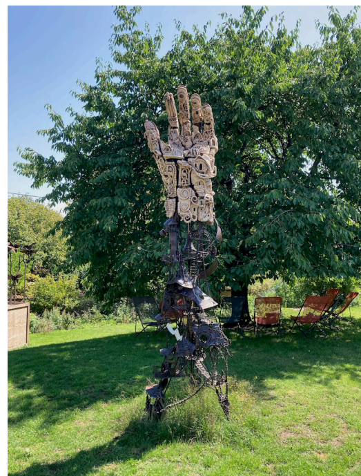
Le jardin avec la sculpture "La Main" des sculpteurs Frantz et Philippe Pasqualini