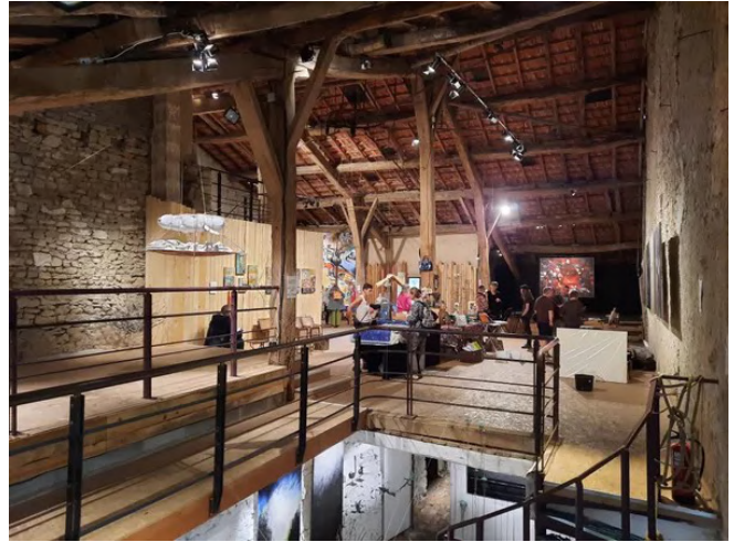
Un espace d'exposition immense, un écrin "magique" selon les artistes