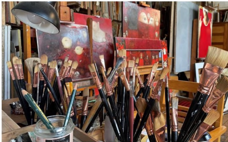
Les ateliers sont parfois remplis à profusion. Ici celui de Stéphane Galmiche, l'un des quinze exposants de la Broc'Art 2023.

C'est dans cette grange, qui combine aussi bien petites salles que larges volumes, montées d'escalier tortueuses et esplanades haut perchées que s'exposent cette année pour la 3 e édition quelque 24 artistes,